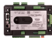
ComAp IntelliGen 200