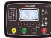
Datakom SMART 200