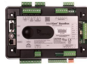
ComAp IntelliGen 200