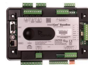
ComAp IntelliGen 200